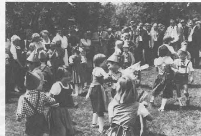
... wo ihm die Kinder etwas vortanzten und ein Ständchen brachten.