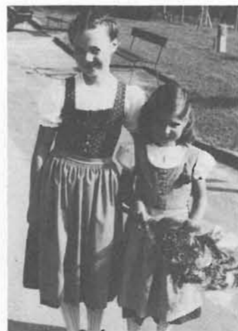
Bild oben: Diese beiden Mädchen begrüßten den Landeshauptmann mit einem Gedicht.