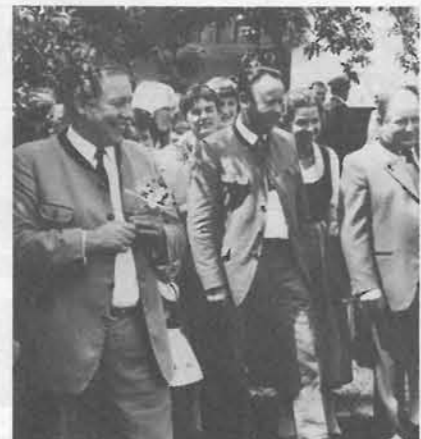
Der Landeshauptmann besuchte auch den Kindergarten...